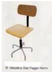
B. Metallico Gas Faggio Norm.