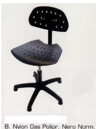
B. Nylon Gas Polipr. Nero Norm.

SU TUTTE LE SEDIE DA NOI COMMERCIALIZZATE ( vedi Brochure Allegata )