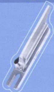
10-3072-0-014/M 高级材质 Advanced material