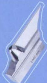
558 2564/M 高级材质 Advanced material