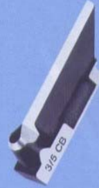
17-0064-5-864 3/5CB 100