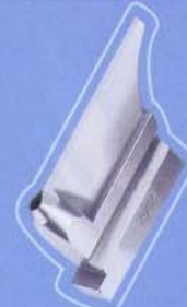
558 2562/M 高级材质 Advanced material