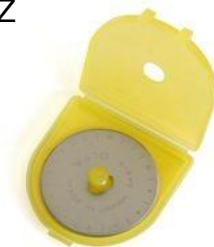
A1178/45OLFA1 1 PZ A1178/45OLFA10 10PZ