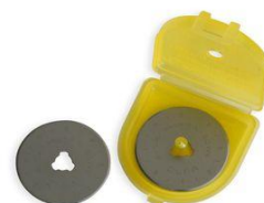
A1175/OLFA28L 1 PZ A1175/OLFA28L10 10PZ