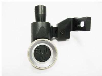
P 119802 mm.26