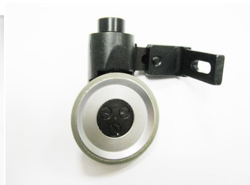
P 119803 mm.35